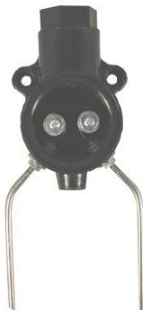
Рисунок 1 – Датчик уровня–протечки двухэлектродный кондуктометрический ДУ–2Кл (Датчик условно показан без крышки)

4.3 Датчик без транспортной упаковки следует хранить в отапливаемом помещении с естественной вентиляцией, при температуре окружающего воздуха от плюс 5 до плюс 40 °С и относительной влажности до 80 % при температуре плюс 25 °С.